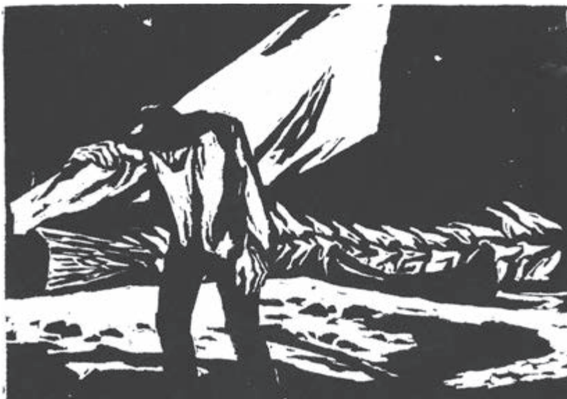
老人与海（木刻）包剑斐 作

等他驶进小港，露台饭店的灯光已经熄灭，他知道大家都上床歇息了。先前的微风越刮越大，此时已经非常强劲。不过，海港里静悄悄的，他驾船来到岩石下面的一小片沙石滩。没人帮忙，他只好一个人把船尽可能往上拖，随后跨出来，把小船紧紧地系在一块岩石上。