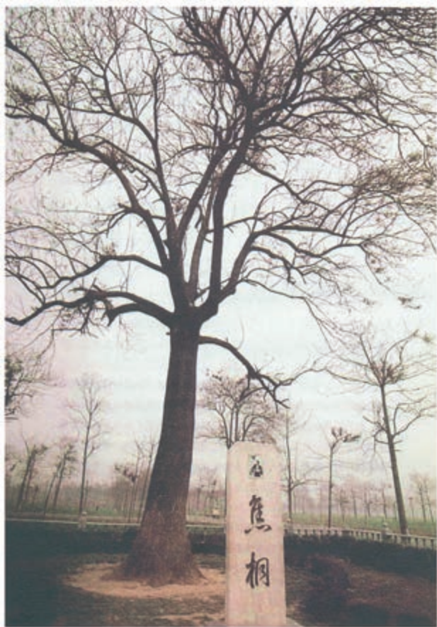
焦裕禄当年为了防风固沙，帮助农民摆脱贫困，提倡种植泡桐。如今，兰考泡桐如海，焦裕禄当年亲手栽下的树苗已长成合抱大树，人们亲切地把它称作“焦桐”。

焦裕禄同志，你没有辜负党的希望，你出色地完成了党交给你的任务，兰考人民将永远忘不了你。你不愧为毛泽东思想哺育成长起来的好党员，不愧为党的好干部，不愧为人民的好儿子！你是千千万万在严重自然灾害面前，巍然屹立的共产党员和贫下中农革命英雄的代表。你没有死，你将永远活在千万人的心里！