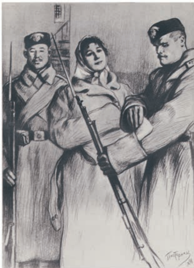
玛丝洛娃 [苏]列奥尼德·帕斯特纳克 作

玛丝洛娃怎么也没想到会看见他，特别是在此时此地，因此最初一刹那，他的出现使她震惊，使她回想起她从不回想的往事。最初一刹那，她模模糊糊地想起那个充满感情和理想的新奇天地，这是那个热爱她并为她所热爱的迷人青年给她打开的。然后她想到了他那难以理解的残酷，想到了接二连三的屈辱和苦难，这都是紧接着那些醉人的幸福降临和由此而产生的。她感到痛苦，但她无法理解这事。她就照例把这些往事从头脑里驱除，竭力用堕落生活的特种迷雾把它遮住。此刻她就是这样做的。最初一刹那，她把坐在她面前的这个人同她一度爱过的那个青年联系起来，但接着觉得太痛苦了，就不再这样做。现在这个衣冠楚楚、脸色红润、胡子上洒过香水的老爷，对她来说，已不是她所爱过的那个聂赫留朵夫，而是一个截然不同的人。那种人在需要的时候可以玩弄像她这样的女人，而像她这样的女人也总是要尽量从他们身上多弄到些好处。因为这个缘故，她向他妖媚地笑了笑。她沉默了一会儿，考虑着怎