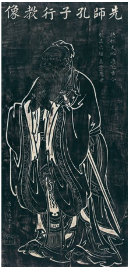
先师孔子行教像（拓本）

子曰：“君子食无求饱，居无求安，敏 ② 于事而慎于言，就有道而正焉 ③ ，可谓好学也已。”（《学而》）