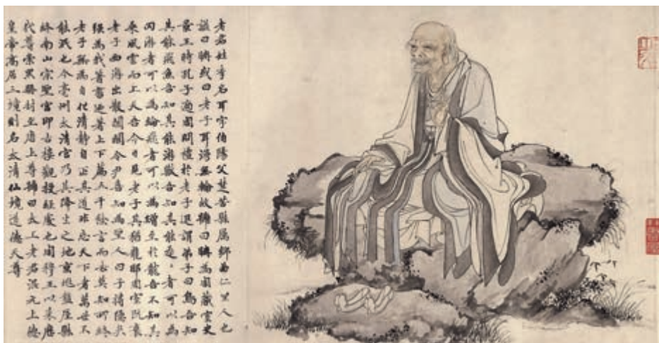
老子像 [元]华祖立 作