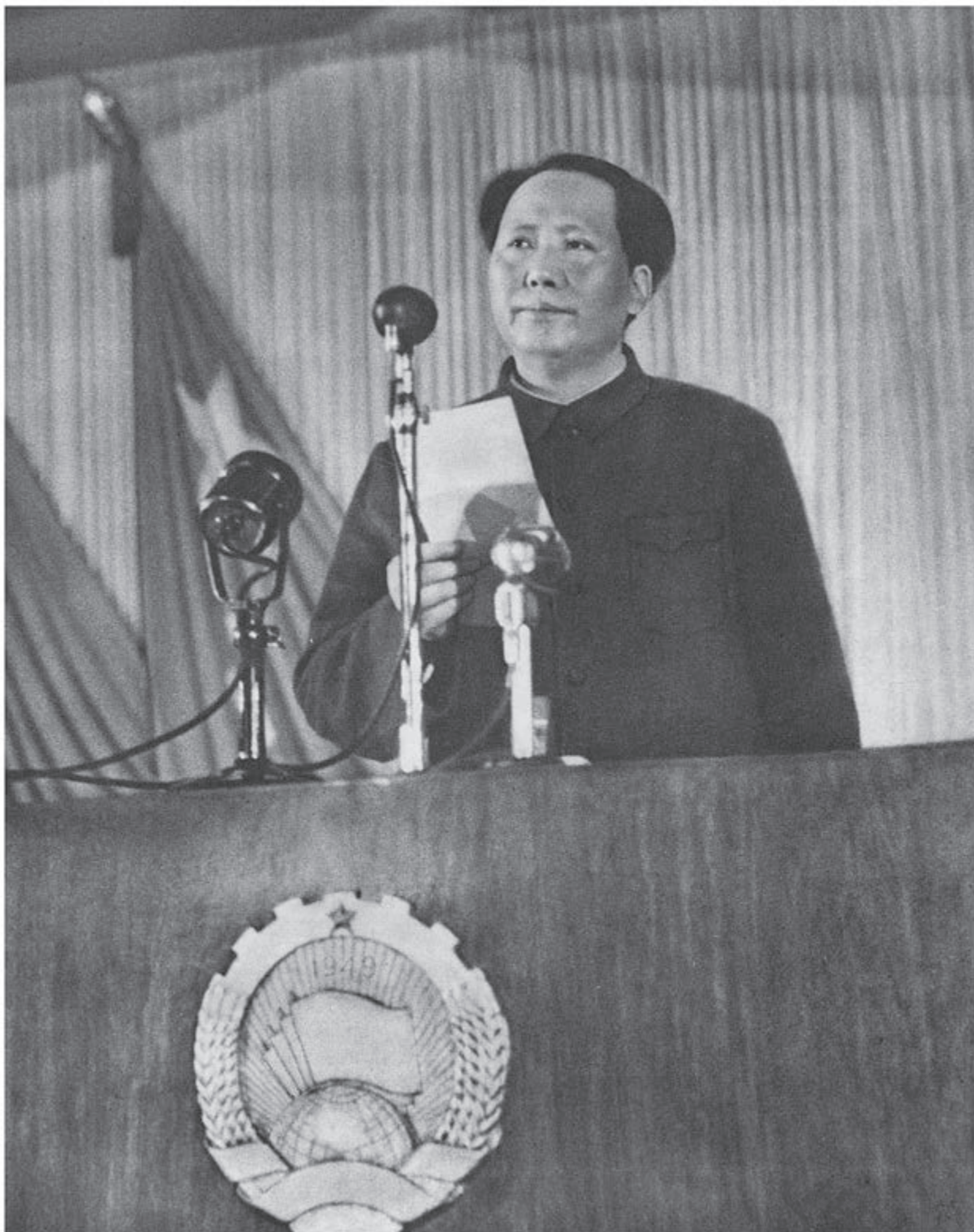
毛泽东在中国人民政治协商会议第一届全体会议上致开幕词