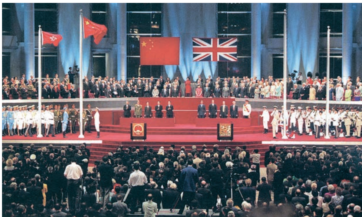
中英香港政权交接仪式

易帜。在1997年6月30日的最后一分钟，米字旗在香港最后一次降下，英国对香港长达一个半世纪的殖民统治宣告终结。