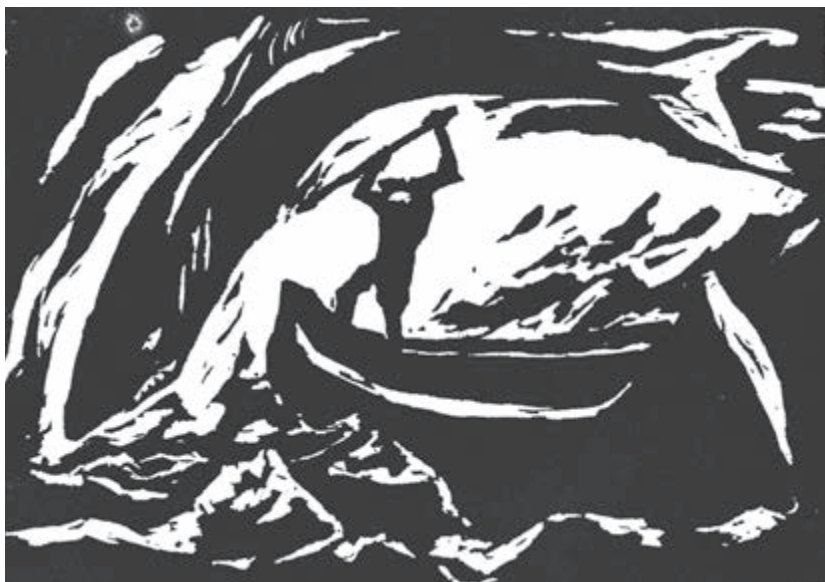
老人与海（木刻）包剑斐 作

鲨鱼飞速靠近船尾，向大鱼发起袭击。老人看着它张开了嘴，看着它那怪异的眼睛，看着它牙齿发出咔嚓一声，朝着鱼尾巴上方的肉扑咬过去。鲨鱼的头从水里钻了出来，后背也正露出海面，老人听见大鱼的皮肉被撕裂的声响，把渔叉猛地向下扎进鲨鱼的脑袋，正刺在两眼之间那条线和从鼻子直通脑后那条线的交点上。这两条线其实并不存在。真实存在的只有沉重而尖锐的蓝色鲨鱼脑袋，大大的眼睛，还有那嘎吱作响、伸向前去吞噬一切的大嘴。可那是鱼脑所在的位置，老人直刺上去。他使出全身力气，用鲜血模糊的双手把渔叉结结实实地刺了进去。他这一刺并没有抱多大希望，却带着十足的决心和恶狠狠的劲头儿。