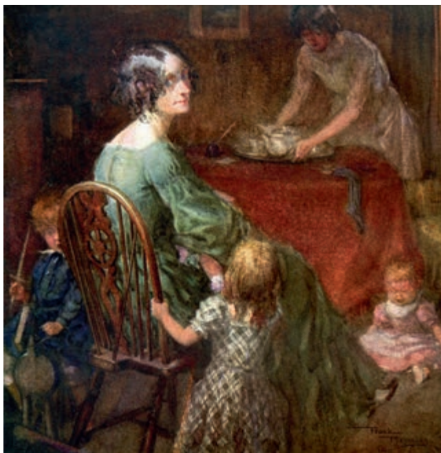
米考伯太太 [英] 弗兰克·雷诺兹 作

他们家另外还有两个孩子：大约四岁的米考伯少爷和大约三岁的米考伯小姐。在这一家人中，还有一个黑皮肤的年轻女人，这个有哼鼻子习惯的女人是这家的仆人。不到半个小时，她就告诉我说，她是“一个孤儿”，来自附近的圣路加济贫院。我的房间就在屋顶的后部，是个闷气的小阁楼，墙上全用模板刷了一种花形，就我那年轻人的想象力来看，