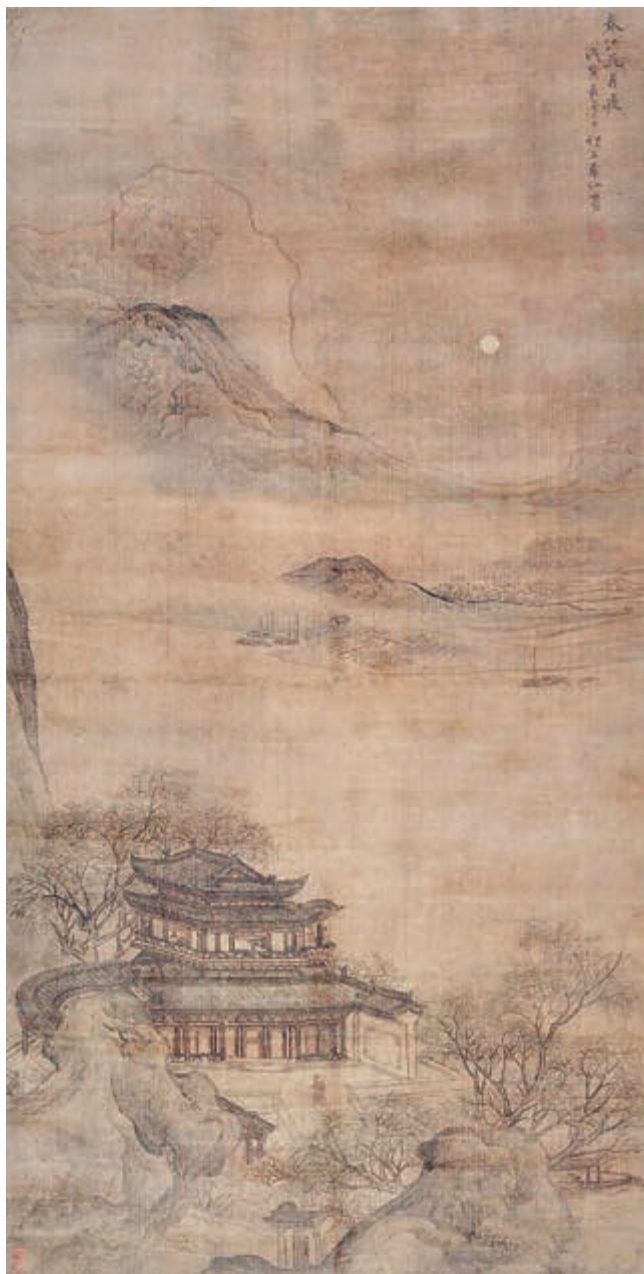
春江花月夜 [清]袁江 作

这首诗以月升、月悬、月斜、月落为线索，贯串叙事、写景、议论、抒情，把春、江、花、月、夜的景色和情理融为一体，空灵而美妙；而所有场景的转换都有内在的连续性，自然而流畅。毫无疑问，这一切是因为人的观照：人对美景的赏鉴和美景对人的情思的启发，自然的恒久与个体生命的短暂，游子的离情别绪和亲人的相思之苦，交互感发，让人心旌摇荡。诵读这首诗，感受诗人以月为核心意象营造出的空灵曼妙的意境，体会其中寄寓的情怀和哲思。